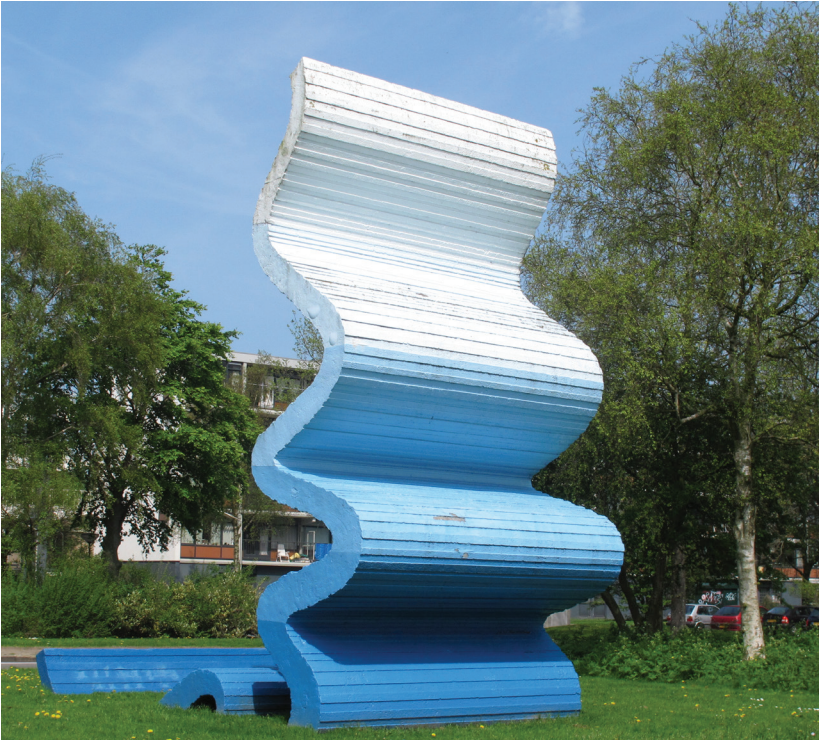
Route B Route Leeuwarden West en Noord